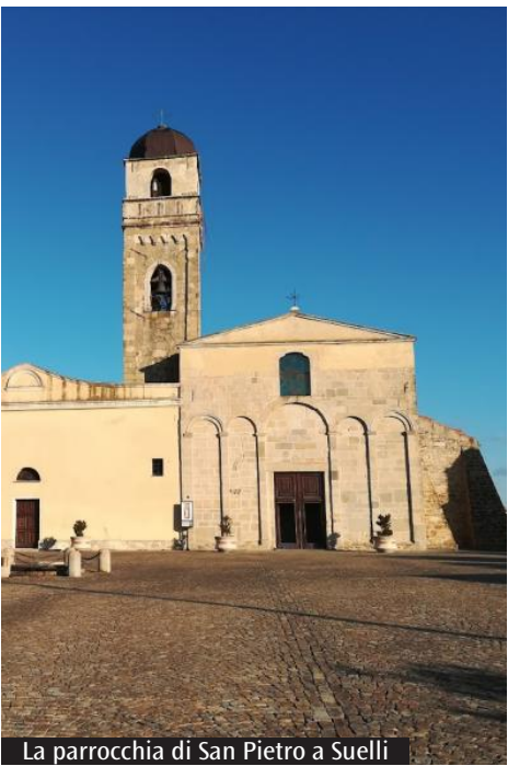
La parrocchia di San Pietro a Suelli

munità della zona. «Nel Direttorio diocesano per i vicariati foranei con il quale l'Arcivescovo ha voluto sollecitare la nostra chiesa diocesana a un rinnovamento di comunione, partecipazione e missione, emerge con forza – afferma don Loi – l'esortazione a favorire al massimo grado la pratica di quella intima fraternità sacramentale che unisce i presbiteri in virtù della comune ordinazione e missione e a promuovere la logica integrativa della comunione fra le parrocchie anche attraverso celebrazioni interparrocchiali. Il momento di grazia che vivremo stasera vuole significare anche una importante occasione per vivere, nella liturgia, la comunione presbiterale e comunitaria, che si apre alla carità. Perciò abbiamo pensato di porre un segno di carità, ascoltando l'invito dell'Arcivescovo nella sua lettera pastorale per il giubileo 2025 e la quale sarà devoluta per il progetto di microcredito "Mi fido di noi".