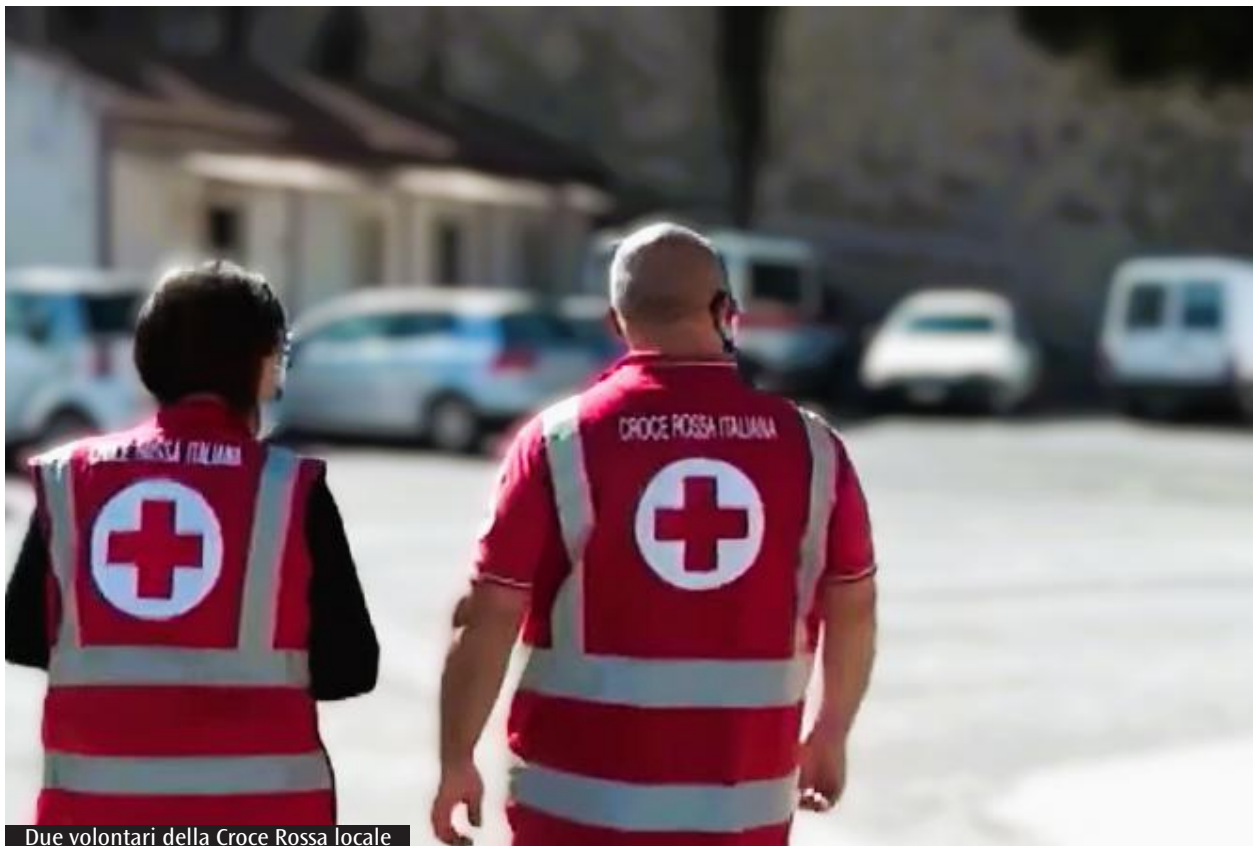
Due volontari della Croce Rossa locale