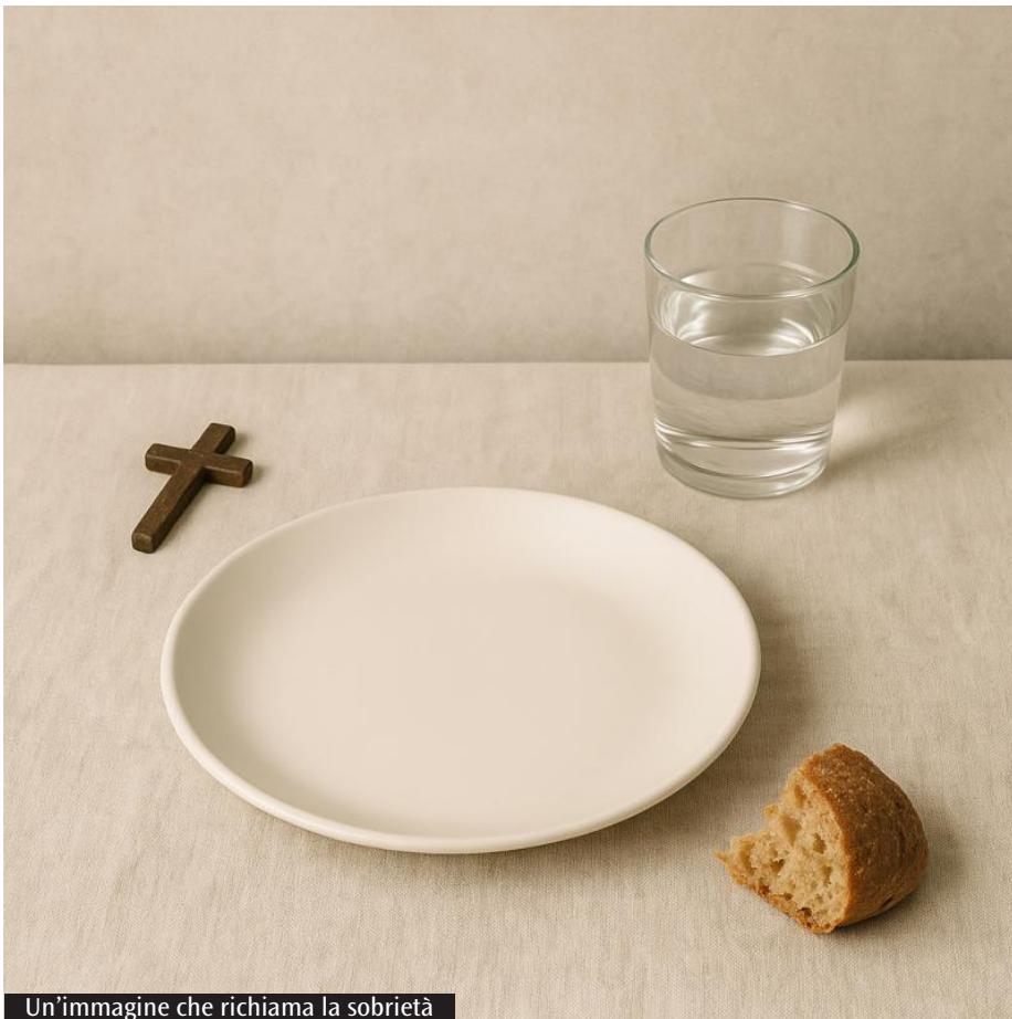
Un'immagine che richiama la sobrietà

* presidente Istituto diocesano sostentamento clero