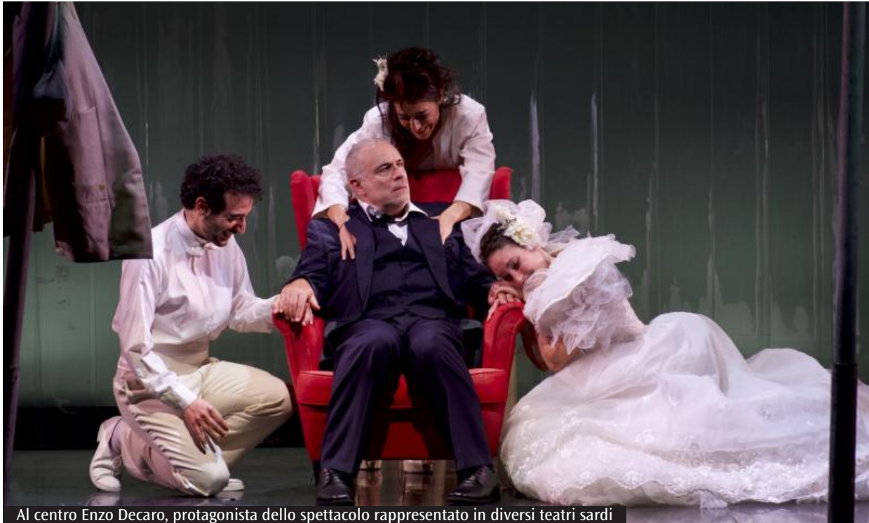
Al centro Enzo Decaro, protagonista dello spettacolo rappresentato in diversi teatri sardi

Una tournée che attraversa la Sardegna, cinque tappe per portare in scena un classico della tradizione teatrale italiana. Enzo Decaro interpreta «Non è vero ma ci credo», celebre commedia di Peppino De Filippo, in un adattamento che sposta l'azione dagli anni '30 agli anni '80, per restituire in chiave più contemporanea il tema della superstizione e delle fragilità umane. «È un classico del teatro, non solo napoletano, ma italiano ed europeo, e come tutti i grandi classici ha quelle incredibili caratteristiche che lo rendono contemporaneo in ogni epoca» spiega l'attore ai microfoni di Radio Kalaritana. La tournée ha già toccato Carbonia, Nuoro, Olbia, Tempio Pausania e si conclude questa sera alle 21 al teatro Ballero di Alghero. Un viaggio che, secondo Decaro, ha offerto una sorpresa inaspettata. «Devo subito - afferma l'attore - sfatare la solita, abituale riservatezza del pubblico sardo, che invece si è rivelato entusiasta ed espansivo. Ritrovare il teatro vivo in un mondo che sta diventando sempre più digitale è un'esperienza bellissima. Lo spettacolo dal vivo, quell'incontro