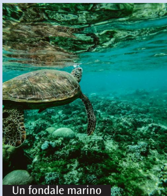
Un fondale marino

L'2025 si è prospettato sin da subito un anno d'oro per il turismo in Italia. Secondo l'analisi condotta dal gruppo Vamonos-Vacanze.it, sulla base dei dati elaborati da Istat e Banca d'Italia, si stima che, includendo anche il turismo interno, nel corso dell'anno ci saranno 182,5 milioni di turisti che sceglieranno il nostro Paese per le vacanze, generando 658,9 milioni di pernottamenti. Tutte le regioni avranno un andamento positivo. Per la Sardegna sono previsti sette milioni di arrivi, oltre 33 milioni e mezzo di pernottamenti e quattro miliardi di euro di spesa complessiva. Secondo un sondaggio promosso di recente da Sabre, la maggior parte degli intervistati prevede di fare almeno due vacanze. Solo il 3% delle persone ha dichiarato che non farà vacanze quest'anno, una diminuzione significativa rispetto al 9,4% del 2024.