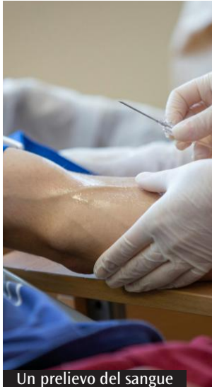
Un prelievo del sangue

nel registro fino ai 55 anni. Per trovare i giovani andiamo nelle scuole, nelle caserme e in particolare la scuola allievi carabinieri di Iglesias ci sostiene molto, oltre le università. Collaboriamo anche con l'Avis con cui condividiamo un protocollo d'intesa per diffondere insieme la cultura del dono». Gianfranco Tintis, delegato di Admo per la Sardegna, sottolinea che «ogni anno in Italia ci sono dai 1600 ai 1800 pazienti in attesa di un donatore non familiare. La probabilità di compatibilità è uno su 100.000. Ma donare è semplice, basta sdraiarsi su una poltrona, con un ago in vena. Un gesto che può davvero salvare una vita». (M.L.S.)