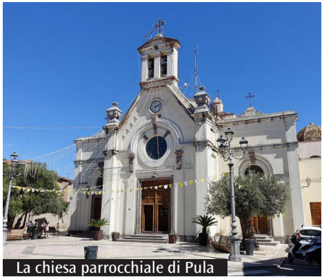
La chiesa parrocchiale di Pula

Si conclude oggi in Trexenta il ciclo di appuntamenti per la Giornata del malato. La forania di Capoterra celebra nel pomeriggio il Giubileo interparrocchiale con l'arcivescovo Baturi