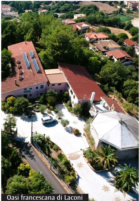
Oasi francescana di Laconi