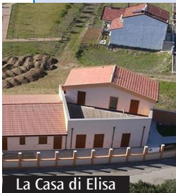
La Casa di Elisa