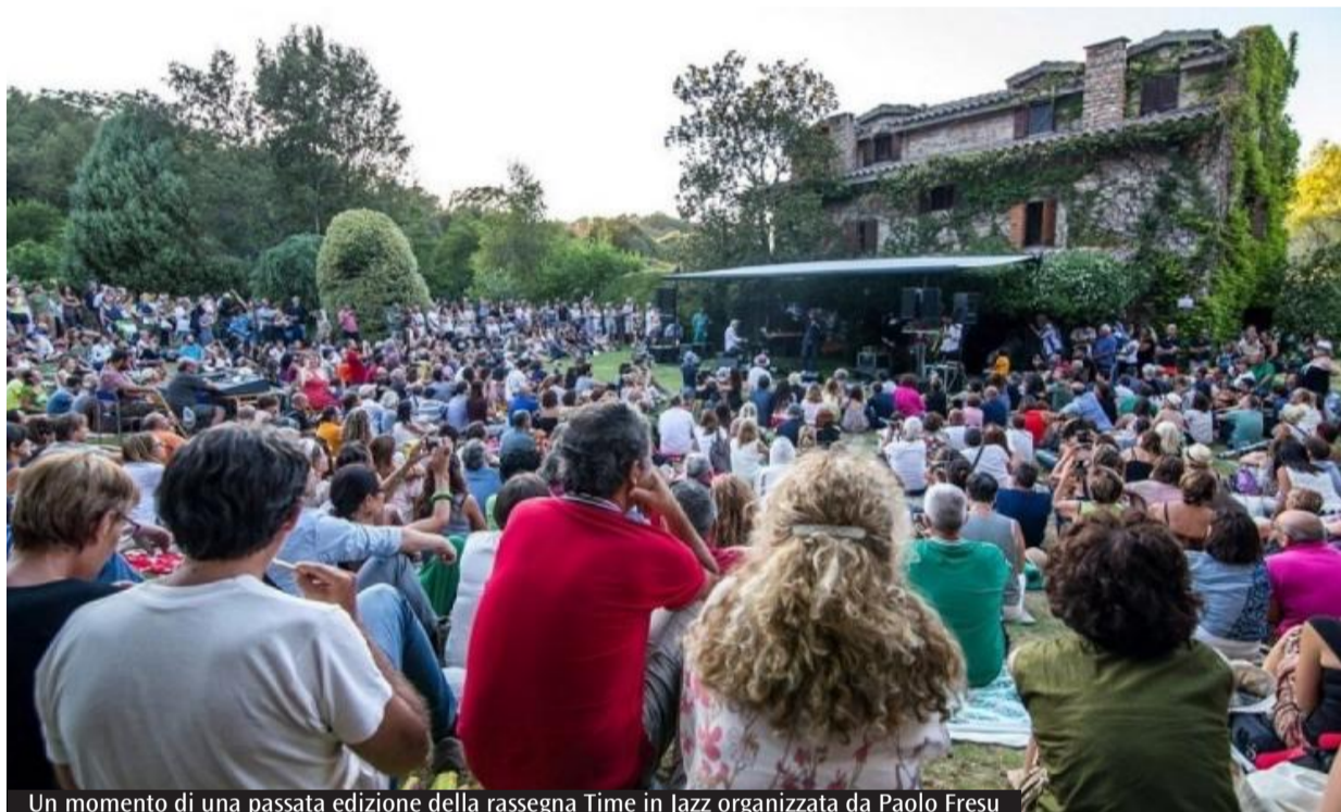
Un momento di una passata edizione della rassegna Time in Jazz organizzata da Paolo Fresu

Un paese che diventa un laboratorio umano. Un senso di comunità che lascia spalancate le porte a chi arriva per ascoltare, interrogarsi, dialogare. Berchidda si prepara ad accogliere, ad agosto, la trentottesima edizione del festival Time in Jazz, diretto, come accade dal 1988, da Paolo Fresu. «Nelle ultime quattro edizioni – racconta Fresu – abbiamo scelto dei temi consequenziali. Siamo partiti da «Rainbow», in cui parlavamo di diversità e uguaglianza e passati a «Futura», richiamando Lucio Dalla, in cui volevamo dare attenzione alle nuove generazioni e alle donne. L'anno scorso è stata la volta di «A Love Supreme», da un disco di John Coltrane, per parlare d'amore in senso totale. Quest'anno partiremo, invece, da Louis Armstrong e dalla sua «What a Wonderful World». Viviamo un momento buio della storia, vogliamo provare a dare un'iniezione di positività nei confronti del prossimo. Il tema si lega bene anche al nostro «Time to Children», dedicato ai più piccoli. Vale per tutte le generazioni». Dal 8 al 16 agosto ci sarà così spazio per mettere in circolazione un messaggio universale. «L'idea – continua il trombettista – è che la musica possa conti-