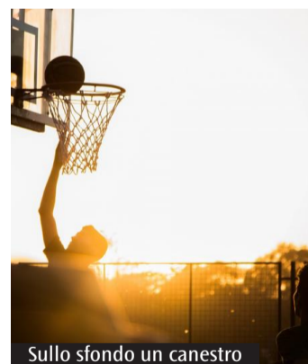
Sullo sfondo un canestro

Dagli anni '50 l'ente promuove momenti di socialità, spaziando fra le diverse discipline per favorire incontri e per generare forme d'invecchiamento attivo