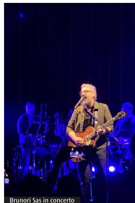
Brunori Sas in concerto

Blues. Un mini-tour isolano che anticipa l'arrivo di un altro artista dalla pena riconoscibile. Il 3 agosto, infatti, all'anfiteatro Ivan Graziani di Alghero, sarà Brunori Sas a far cantare vecchi e nuovi appassionati della sua musica. Il tuffo nel cantautorato anticipa il ritorno della forza e dei ritmi della musica urban, con Gue Pequeño e Irama che sono tra gli artisti già annunciati per il prossimo Red Valley, a Olbia: la data scelta è quella del 16 agosto. Il calendario però potrebbe divenire più fitto nelle prossime settimane. Si attendono ancora infatti diversi annunci per i giorni chiave di ferragosto ma anche per i calendari di altri eventi musicali isolani oltre che di quelli ancora in costruzione come Ateneika o il Red Valley. Diversi artisti visti a Sanremo – da Gaia a Rkomi – potrebbero poi trovare nell'isola spot ideali per presentare al pubblico i propri nuovi album.