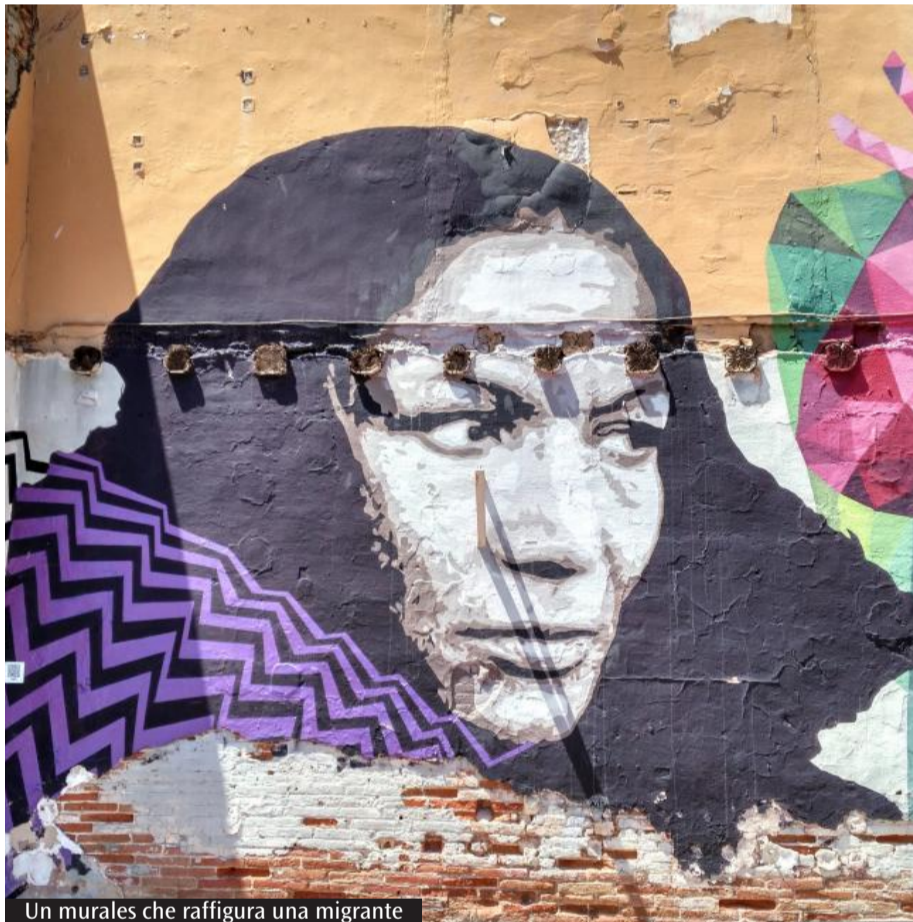
Un murales che raffigura una migrante