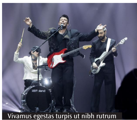
Vivamus egestas turpis ut nibh rutrum

I big della musica nostrana preparano i concerti estivi che, da un capo all'altro della nostra regione, animano le notti, con tanti artisti pronti a esibirsi già a partire da fine mese