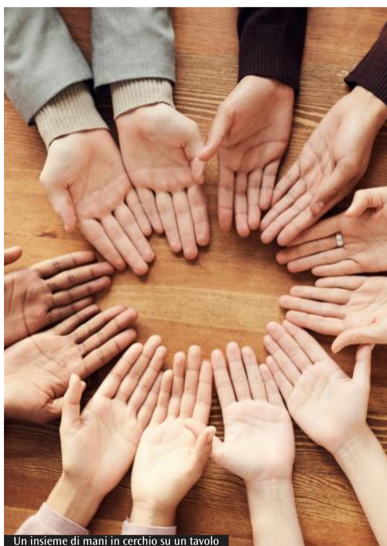
Un insieme di mani in cerchio su un tavolo

che nei singoli territori della nostra regione. «Lavoriamo – aggiunge Pianu – sul coinvolgimento di tutte quelle realtà che, pur non aderendo a reti nazionali, hanno la stessa necessità di rapportarsi con i comuni, con i plus e con le altre istituzioni, per cercare di dare risposte ai cittadini: favoriamo la costruzione di luoghi di incontro e confronto, in modo da rafforzare la partecipazione attiva e la capacità propositiva». Nel futuro «cercheremo di implementare il lavoro territoriale e la stessa adesione al Forum regionale che, ad oggi, conta 18 realtà impegnate in diversi settori, dal volontariato e dalla promozione sociale alla cooperazione».