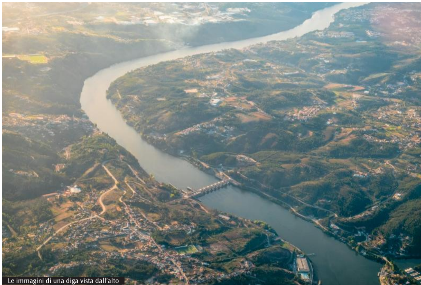
Le immagini di una diga vista dall'alto