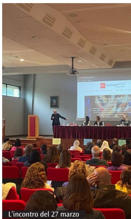
L'incontro del 27 marzo

mento per definire gli ultimi dettagli di questo importante progetto». Il microcredito punta infatti a sostenere persone e famiglie in difficoltà. «L'importo erogabile - precisa Loviselli - è al massimo di 8.000 euro e il prestito è a tasso zero. In questo modo la Chiesa vuole rispondere alle tante emergenze sociali e offrire un aiuto concreto alle persone per ripartire». Un elemento chiave è l'assenza di intermediazione bancaria. «Il fondo unico è depositato presso Banca Etica, che gestisce le somme destinate al progetto», evidenzia Loviselli nel precisare il fondamentale ruolo delle fondazioni anti-usura.