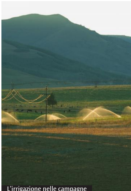
L'irrigazione nelle campagne

D'intesa con gli assessori Satta e Piu, la presidente ha sollecitato proposte per reperire risorse idriche aggiuntive. Ha inoltre invitato il Consorzio di bonifica della Nurra a elaborare un piano di erogazione che minimizzi i danni alle colture e garantisca, in tutti i comuni della Nurra, l'abbveraggio del bestiame.