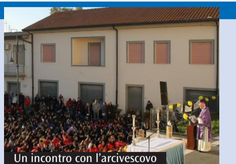
Un incontro con l'arcivescovo