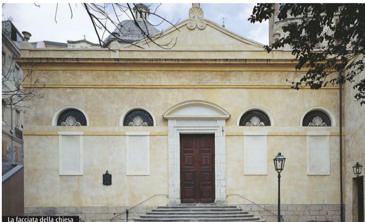
La facciata della chiesa