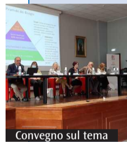
Convegno sul tema

In un contesto in cui la fiducia è stata tradita e il dolore ha toccato i più vulnerabili, la presenza di un Servizio diocesano preposto, fortemente voluta da papa Francesco, si rivela cruciale, come risposta concreta alla lotta contro gli abusi.