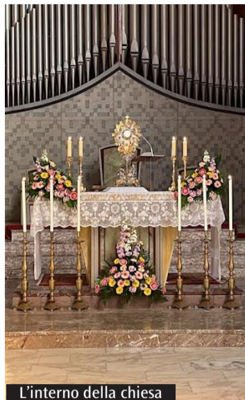
L'interno della chiesa