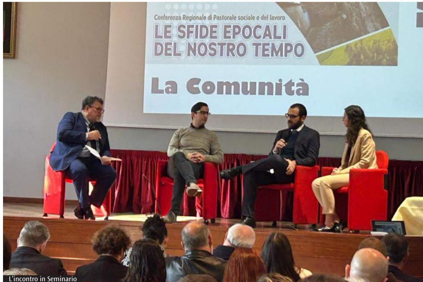
L'incontro in Seminario

Ciò che è emerso nella mattinata di lavori in Seminario a Cagliari è la necessità di un approccio integrato tra istruzione, formazione professionale, supporto all'imprenditorialità e politiche attive del lavoro, per creare lavoro stabile, capace di