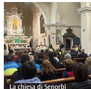
La chiesa di Senorbì