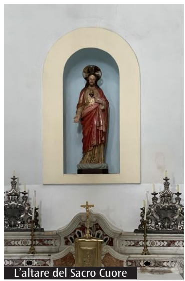
L'altare del Sacro Cuore