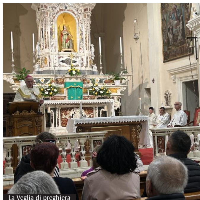
La Veglia di preghiera