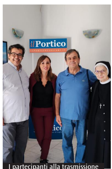
I partecipanti alla trasmissione

Prende il via oggi alle 18 il secondo filone del programma radiofonico «Sovvenire in radio»: la Chiesa in servizio si racconta», dedicato alle offerte per il sostentamento del clero, ideato dal Servizio diocesano per la promozione del Sostegno economico alla Chiesa cattolica, in sinergia con Radio Kalaritana. Dopo il primo ciclo di puntate sul «viaggio» tra le opere realizzate grazie all'8xmille in diocesi, si prosegue con il racconto delle figure di sacerdoti che hanno lasciato tracce importanti nella Chiesa diocesana, con l'obiettivo di sensibilizzare sulle offerte deducibili per i sacerdoti e di comprendere che supportare loro significa sostenere le opere che essi portano avanti nei territori, con ricadute signi-