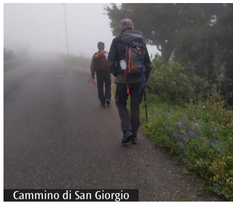
Cammino di San Giorgio

La terza edizione del progetto «Noi Camminiamo in Sardegna» ha messo in evidenza otto cammini spirituali, sette dei quali iscritti al registro regionale