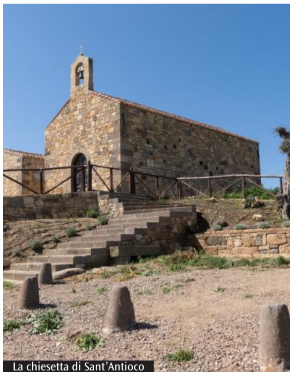
La chiesetta di Sant'Antioco