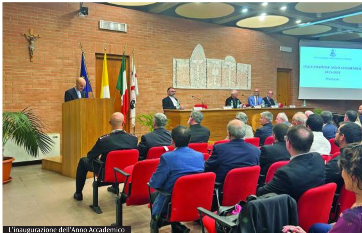
L'inaugurazione dell'Anno Accademico

Sono invece cominciate lunedì scorso le lezioni del primo ciclo, al termine della quale si consegua il baccellierato. «Alcuni fra i docenti in servizio in Facoltà - evidenzia il preside - svolgono attività accademica anche all'interno dell'Istituto superiore di scienze religiose, ospitato sempre negli spazi di via Sanjust. Sono in tutto 17. Se a questi si aggiungono anche