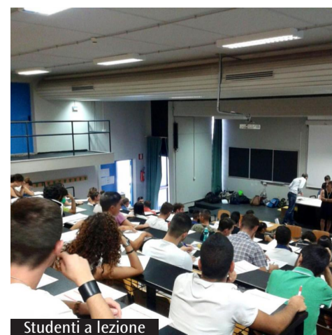
Studenti a lezione

Presentato rapporto «Metè 2024» delle Acli, crolla la popolazione: il calo demografico sta arrivando a dimensioni disastrose