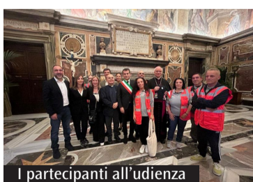
I partecipanti all'udienza

L'iniziativa è promossa dalla Conferenza episcopale italiana e da Caritas Italiana. Anche una delegazione di Cagliari all'udienza con papa Francesco