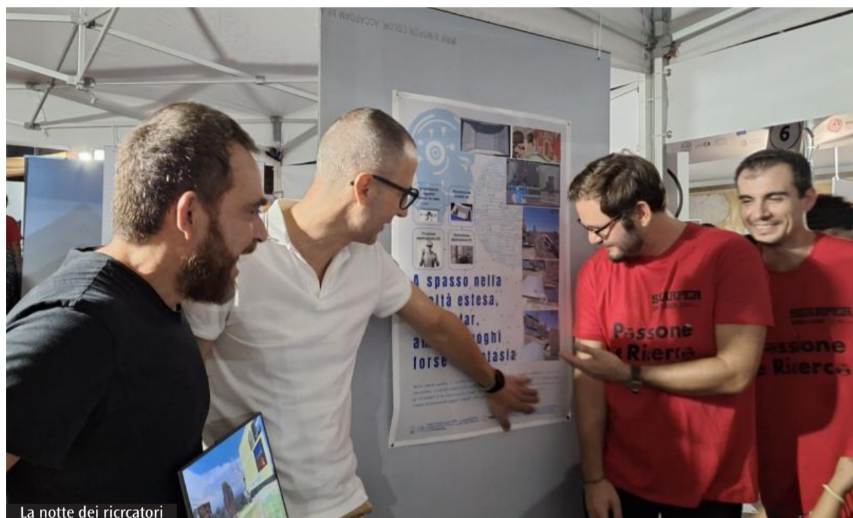
La notte dei ricercatori