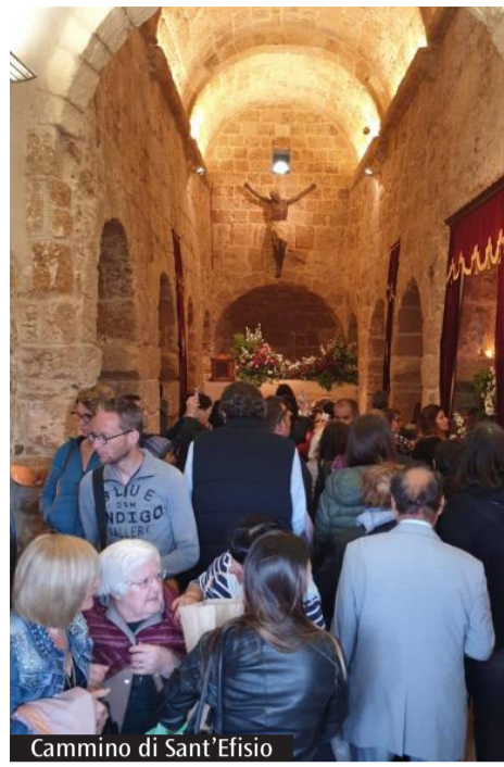
Cammino di Sant'Efisio