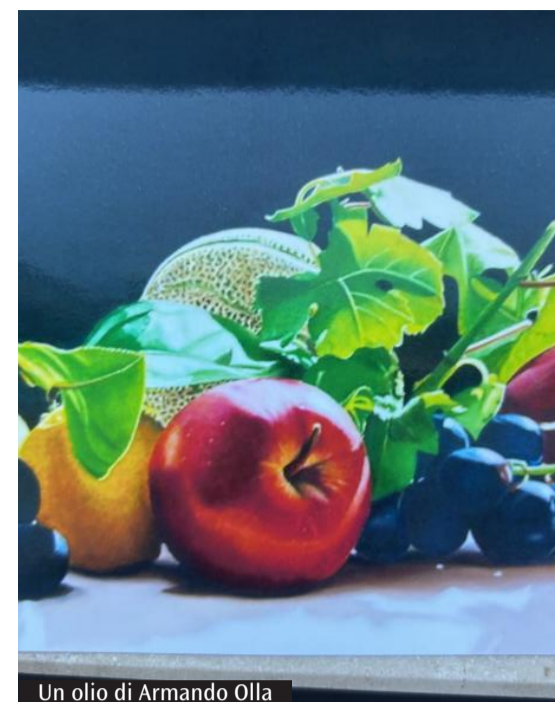
Un olio di Armando Olla

L'Exmà ha ospitato la terza edizione della Notte dei ricercatori europea, manifestazione che unisce 15 atenei italiani con il resto del Vecchio continente