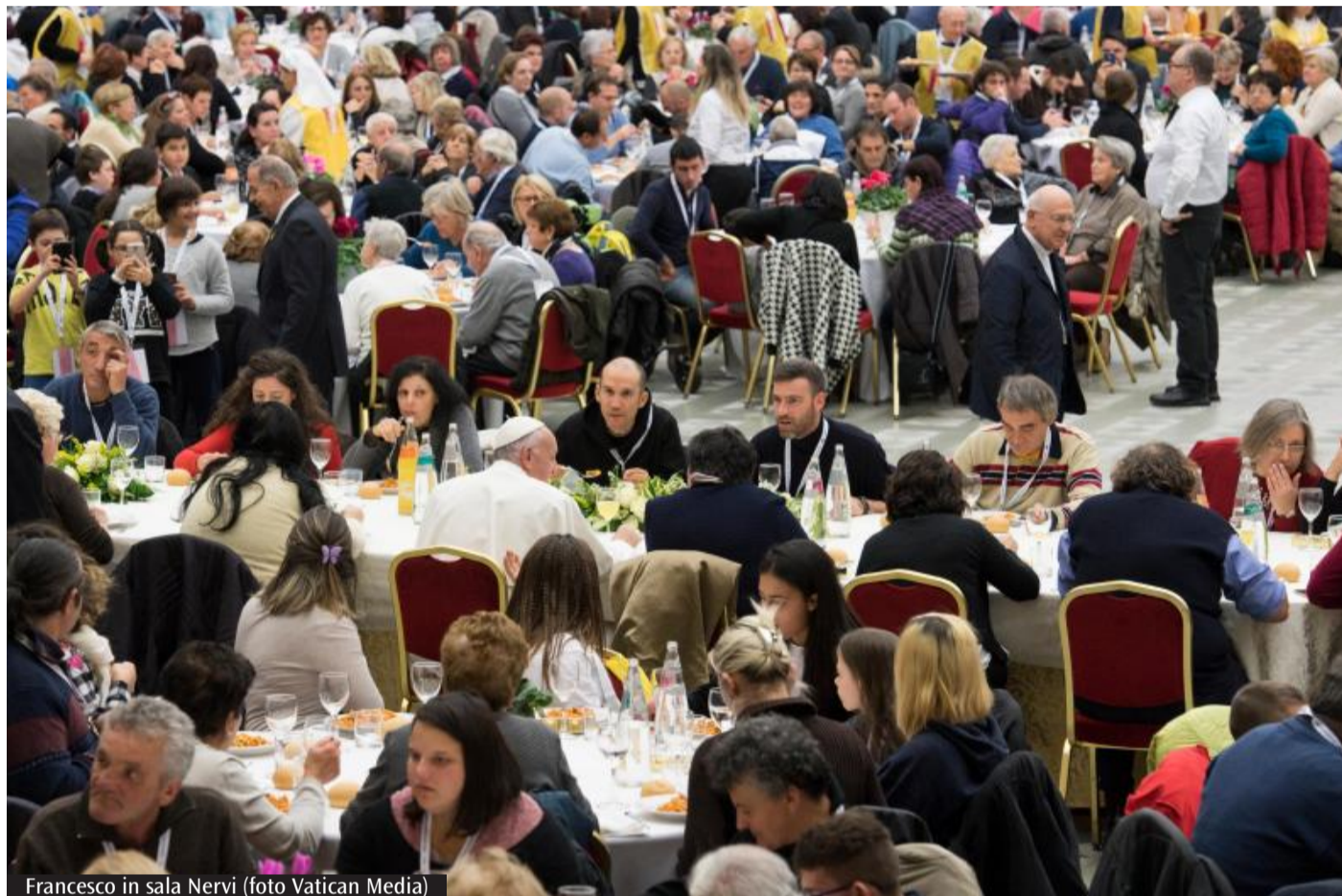
Francesco in sala Nervi

Questo richiede una Chiesa sinodale-missionaria, dove la missione e la sinodalità sono strettamente legate, lavorando insieme per annunciare il Vangelo. Una stretta cooperazione missionaria risulta oggi ancora più urgente e necessaria