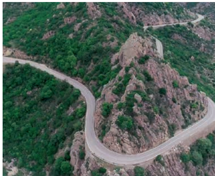
I TORNANTI DELLA STATALE 125

Nello specifico le imprese di montagna sono 3.619, il 3% di tutte quelle registrate, con 7.527 addetti, il 2,1% del totale dei lavoratori sardi. Ne fanno parte le 1.564 realtà artigiane (18,7 del totale delle attività montane) con i 2.705 addetti (il 39,1% degli addetti montani). Il fatturato montano arriva a 679 milioni di euro, l'1,5% del totale sardo, con un valore aggiunto di 203 milioni di euro (l'1,6% del totale). Il