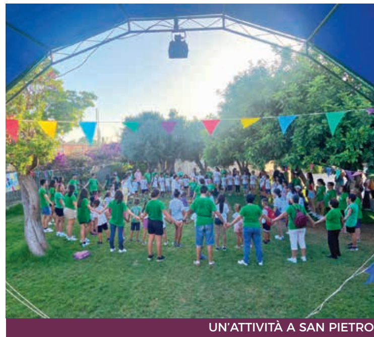
UN'ATTIVITÀ A SAN PIETRO

Visto le numerose richieste, si è proposto un laboratorio anche ai bambini tra i 3 e i 6 anni, che sono stati impegnati in realizzazione di cartelloni, attività manuali e balli. Sono stati pensati anche due laboratori per adulti e genitori: grazie alla collaborazione della Confraternita di Misericordia, i genitori hanno potuto frequentare il corso di primo soccorso e BLS, per un oratorio sempre più sicuro. Inoltre, alcuni genitori e un gruppo di animatori hanno potuto frequen-