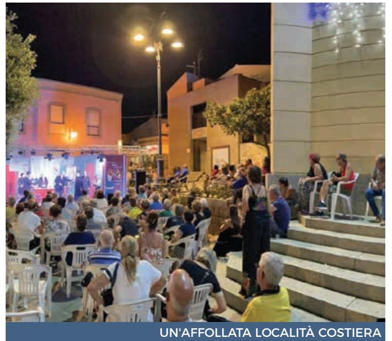
UN'AFFOLLATA LOCALITÀ COSTIERA

Un afflusso dal doppio volto che secondo il genovese, sotto alcuni aspetti, ha avuto anche un impat-