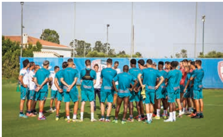
IL CAGLIARI AD ASSEMINI

ntensità. Se dovesse essere scelta una parola per descrivere le prime due settimane di lavoro del Cagliari potrebbe essere questa la parola giusta. Agli ordini del nuovo tecnico Davide Nicola i rossoblù hanno infatti da