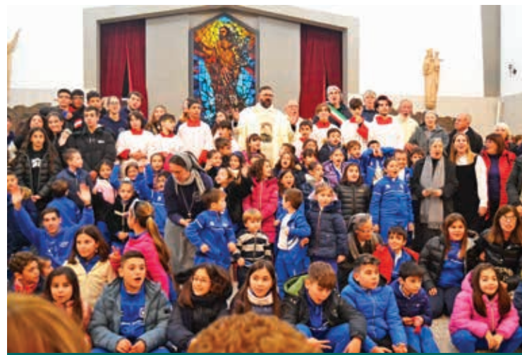
LA RECENTE CELEBRAZIONE DI SAN GIOVANNI BOSCO