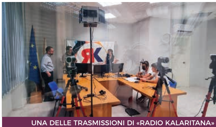
UNA DELLE TRASMISSIONI DI «RADIO KALARITANA»