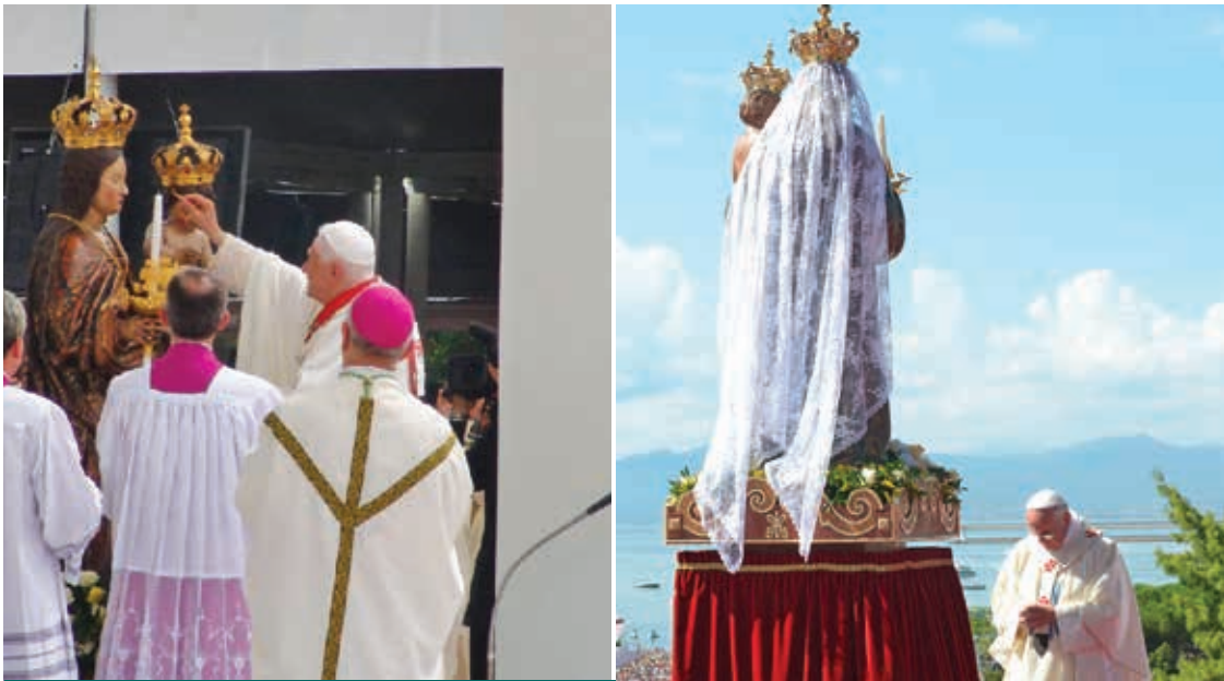
BENEDETTO XVI E FRANCESCO A CAGLIARI