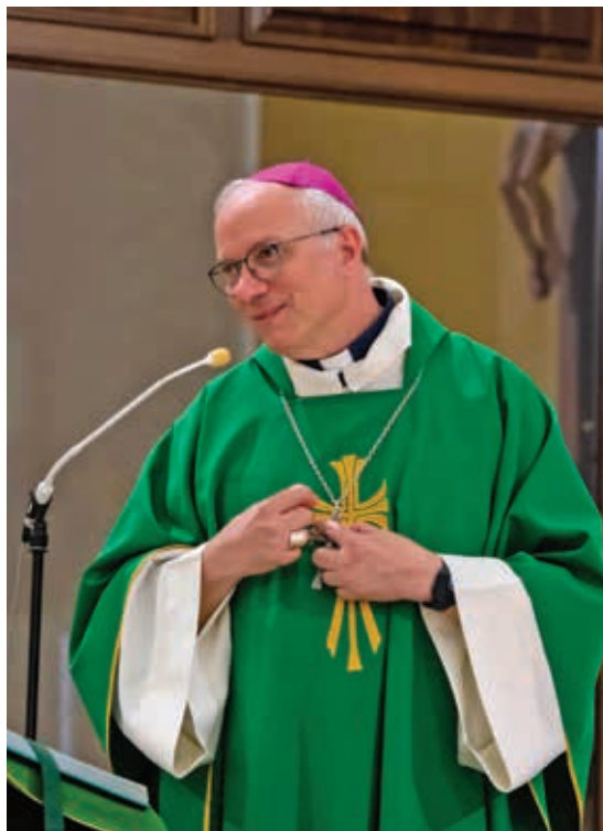
MONSIGNOR GIUSEPPE BATURI

Nella sua riflessione monsignor Baturi ha poi posto l'accento sulla croce, come elemento di unità, citando sempre l'apostolo Paolo «non vi è più Greco o Giudeo, circoncisione o incirconcisione, barbaro,