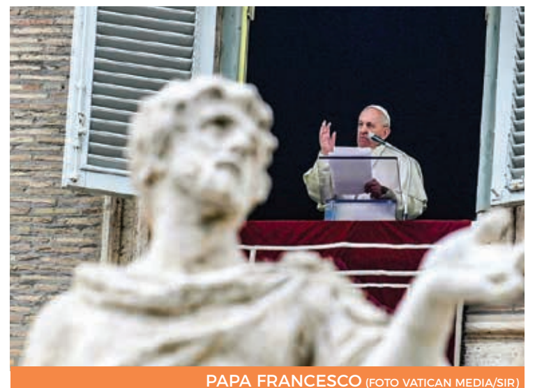
PAPA FRANCESCO

Nel suo Messaggio papa Francesco ha formulato l'auspicio che «le Olimpiadi di Parigi siano per tutti coloro che verranno da tutti i Paesi del mondo un'occasione da non perdere per scoprirsi e apprezzarsi, per abbattere i pregiudizi, per far nascere la stima