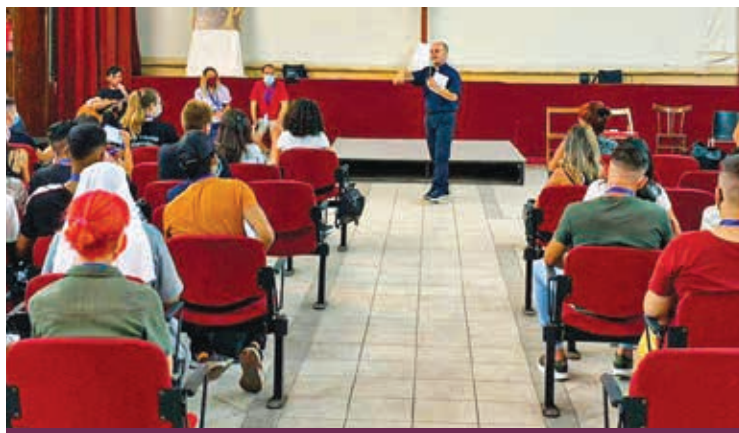
ATTIVITÀ DEL CAMPO CARITAS

I nizia domenica la XII edizione del Campo Estivo Internazionale di volontariato «Gli occhi del cuore», organizzato dalla Caritas diocesana di Cagliari attraverso il suo braccio operativo la