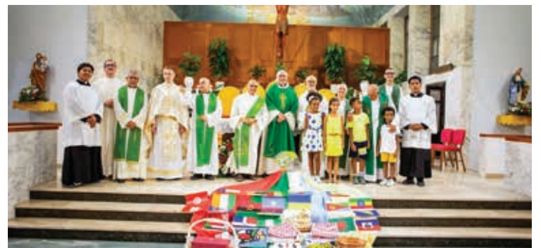
ALCUNI MOMENTI DELLA FESTA DEI POPOLI

la giornata, alle 21 l'Arcivescovo ha presieduto nella vicina chiesa di Sant'Elia, la celebrazione della Messa, animata dal coro filippino e dalle varie comunità che hanno donato come segno di amicizia e fraternità alcuni oggetti simbolo della loro cultura.