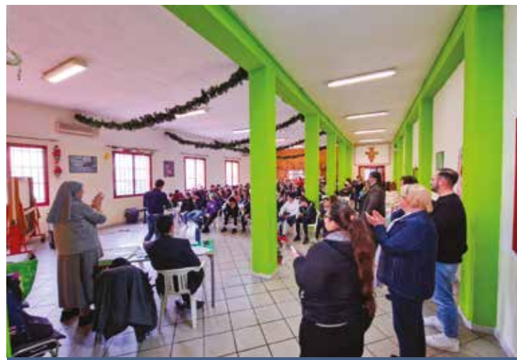
L'INCONTRO IN ORATORIO

Abbiamo raccolto le testimonianze di alcuni parroci presen-