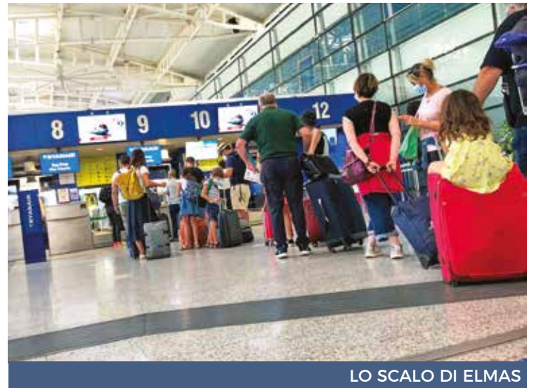
LO SCALO DI ELMAS

EasyJet opererà 5 collegamenti internazionali confermando i voli per Basilea, Ginevra, Londra Gatwick, Parigi Orly e Lione. Eurowings vo-