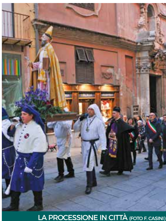
LA PROCESSIONE IN CITTÀ

Sabato mattina la staffetta ha lasciato la Cripta di