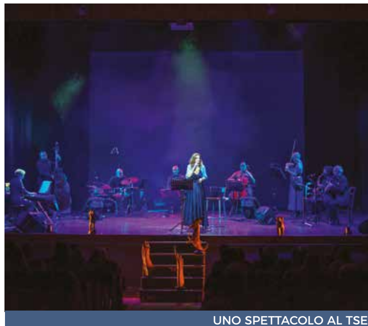
UNO SPETTACOLO AL TSE

Un presidio culturale, quello del TsE, nel cuore di San Michele - Is Mirrionis, quartiere periferico,