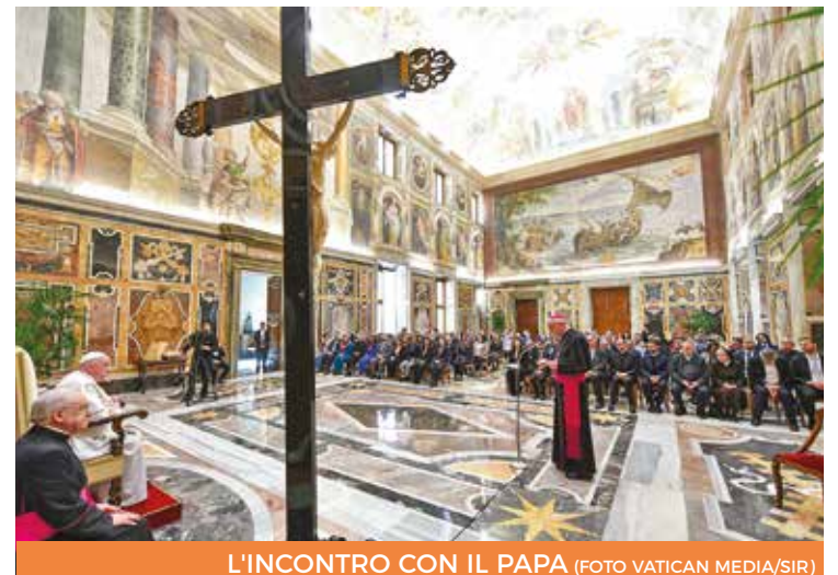
L'INCONTRO CON IL PAPA

La «buona politica» deve essere sostenuta da una spiritualità fatta di «tenerezza» e «fecondità».