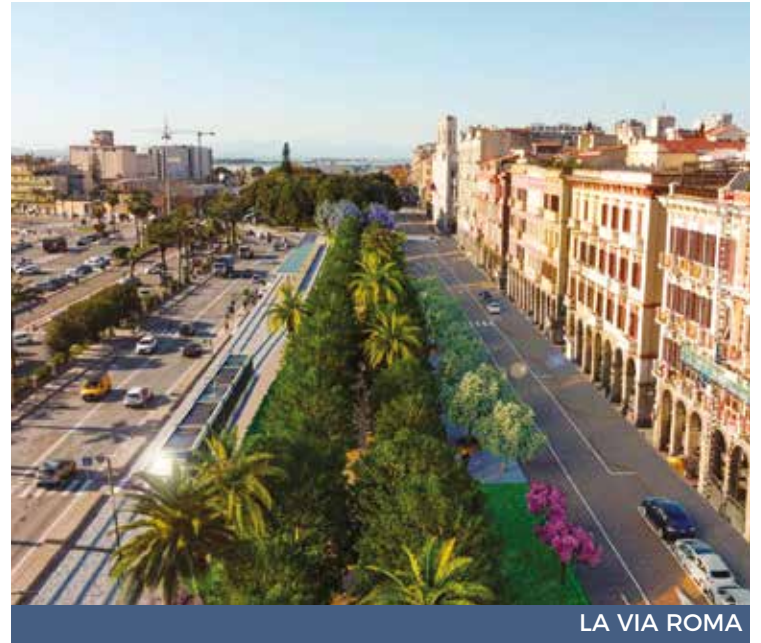
LA VIA ROMA

L'altro grande cantiere è quello di viale Trieste, nel tratto che va da piazza del Carmine all'angolo con via Roma dove il Comune, con oltre sei milioni di euro, ha programmato il rifacimento dei marciapiedi, la sostituzione parziale delle alberature, il rifacimento dell'impianto di illuminazione pubblica e la realizzazione di nuovi impianti di smaltimento delle acque piovane. «Era necessario aprire contemporaneamente due cantieri in altrettante zone centrali di Cagliari - spiega l'assessore alla Viabilità Alessio Mereu - per evitare di perdere i finanziamenti europei». «In questo modo, oltre che più fruibile e più bello, il capoluogo si aprirà completamente sul mare». «En-