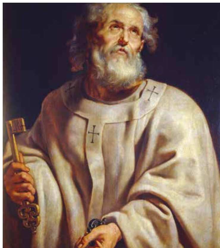
UN'IMMAGINE DI SAN PIETRO

La bella notizia del cristianesimo è che Dio mi ama indipendentemente da quello che faccio, un po' come l'amore che noi abbiamo verso i nostri figli, nonostante ciò che essi fanno. Siamo talmente uniti ai nostri figli che potremmo anche farci uccidere per loro. Alla fine Pietro lo capirà: quando Gesù gli chiede «Pietro ma tu mi ami?» e l'Apostolo riuscirà solo a dire «Tu lo sai che ti voglio bene». Il Signore dirà a Pietro che sa