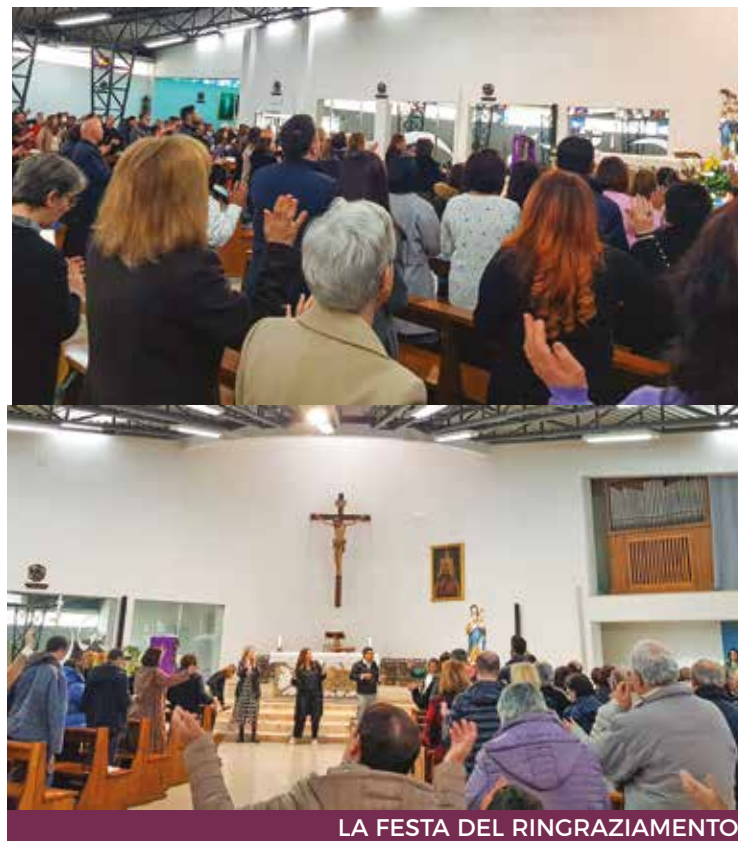
LA FESTA DEL RINGRAZIAMENTO

La coordinatrice diocesana ha poi proseguito ringraziando il Signore per le meraviglie compiute, non solo a livello nazionale, ma anche nella realtà regionale e diocesana del Rinnovamento e, a conclusione del suo resoconto, sono state presentate due testimonianze, una di evangelizzazione attraverso il «Seminario di Vita Nuova», percorso caratteristico del Rinnovamento nello Spi-