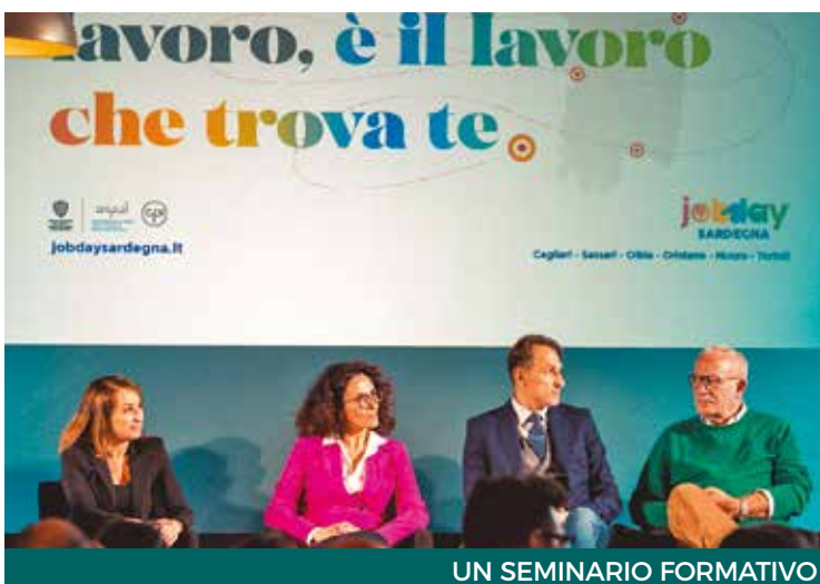
UN SEMINARIO FORMATIVO