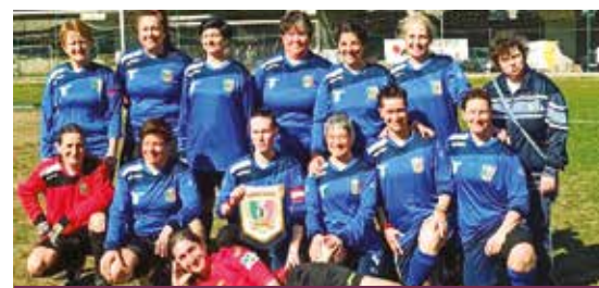
LA NAZIONALE ITALIANA SUORE