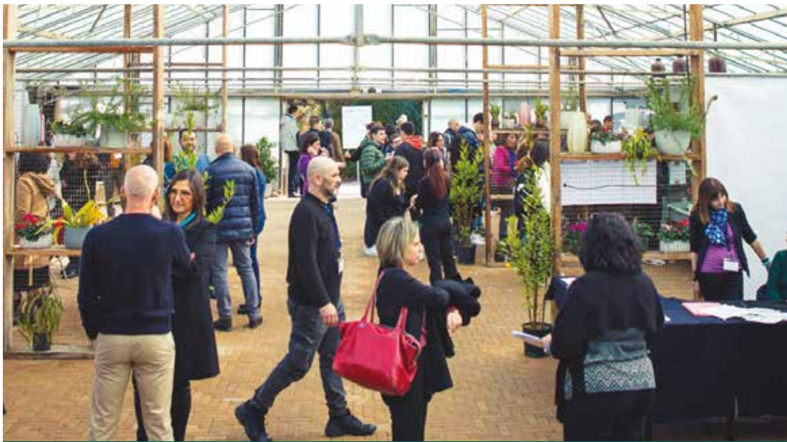
INCONTRI DEL «JOB DAY»