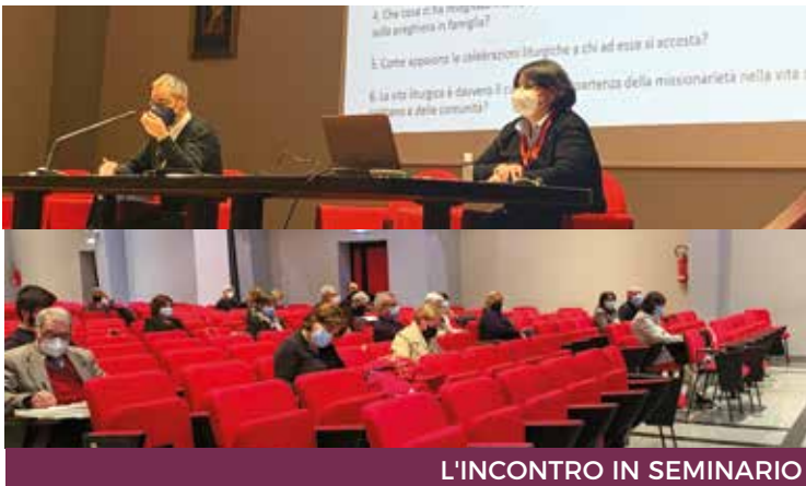
L'INCONTRO IN SEMINARIO

U n incontro in Aula magna del Seminario organizzato dall'Ufficio liturgico diocesano. Un momento per riflettere insieme con chi in un modo o nell'altro si occupa di liturgia. «L'intento - ha affermato ai micro-