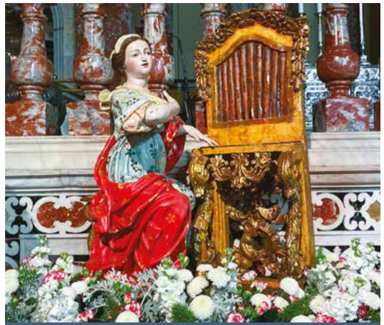
SANTA CECILIA IN CATTEDRALE

della questione dei Tre Capitoli. Questi erano gli scritti di Teodoro, vescovo di Mopsuestia, di Teodoreto, vescovo di Cirro e di Iba, vescovo di Edessa. Proprio il 22 novembre del 544, mentre papa Vigilio celebrava la sinassi nella basilica tiberina venne trascinato dai soldati nella imbarcazione pronta per portarlo a Costantinopoli. Siccome egli dopo la Comunione non aveva ancora recitata l'ultima benedizione, quella che si chiama anche oggi «oratio super populum» ossia «orazione sul popolo» i romani cominciarono ad inveire chiedendo che si desse almeno tempo al Papa di lasciare Roma con la sua benedizione. Per evitare altri tumulti, papa Vigilio dovette pronunciare la benedizione dalla stessa barca, e solo dopo questa benedizione i rematori fecero allontanare l'imbarcazione dalla sponda del Tevere. Questa testimonianza ci dice come la basilica di santa Cecilia fosse tenuta in grande onore e la sua devozione così diffusa, tanto che il Papa stesso vi celebrava una Messa stazionale. Questo onore è sicuramente dovuto alla certezza del luogo del martirio della Santa, identificato proprio con la basilica eretta in suo onore. Questa fu costruita proprio nella casa