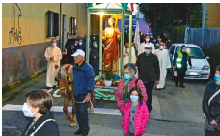
LA PROCESSIONE DEL SS. REDENTORE

Ultima domenica dell'anno liturgico, festa di Cristo Re dell'universo e festa patronale nella chiesa del SS. Redentore di Monserrato.