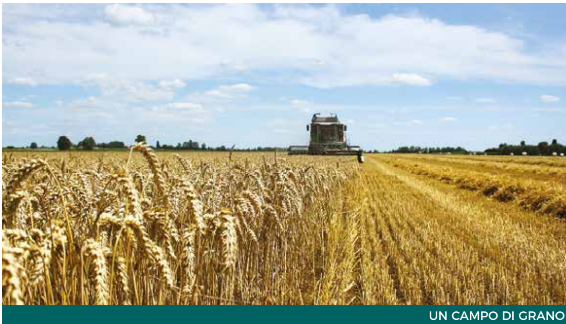
UN CAMPO DI GRANO