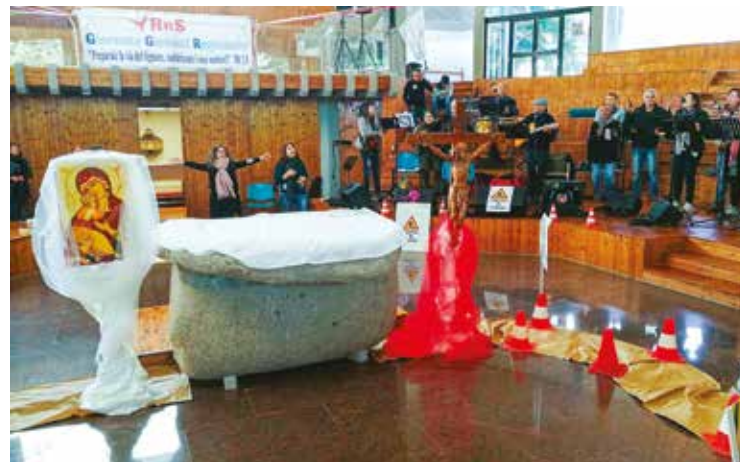
INCONTRO DEI GIOVANI DEL RINNOVAMENTO DELLO SPIRITO

In seguito anche Benedetto XVI si rivolgeva ai responsabili con queste parole: «Cari amici del Rinnovamento nello Spirito Santo! Servono uomini e donne che sentano l'attrazione del Cielo nella loro vita, che facciano della lode al Signore uno stile di vita nuova. E siate cristiani gioiosi!» (26 maggio 2012). Ed infine si vuole rispondere all'appello di papa Francesco con il contributo e l'impegno affinché avvenga «la conversione all'amore di Gesù che cambia la vita e fa del cristiano un testimone dell'amore di Dio», come è già avvenuto da