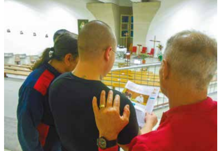
ALCUNI DETENUTI DEL «GRUPPO SINODALE IN CARCERE»

sincera. Diversi hanno sottolineato l'importanza e il ricordo positivo dei tempi del catechismo e della preparazione ai sacramenti; l'esperienza dell'oratorio e del gruppo parrocchiale. Altri sono stati molto critici: «Credo in Dio ma non pratico. Non credo nella Chiesa». La testimonianza negativa offerta da uomini di Chiesa è stato il punto sul quale ci si è soffermati: lo scandalo della pedofilia, l'attaccamento al denaro e, in generale ogni forma di incoerenza. Ascoltando questi fratelli verrebbe da dire: «Ma da quale pulpito viene la predica!» Invece proprio da chi ha commesso degli errori nella vita giunge un richiamo forte, un'esigenza di coerenza, di Vangelo vissuto da persone che nella Chiesa siano testimoni veri di onestà, di carità, di verità. C'è bisogno di questi punti di riferi-