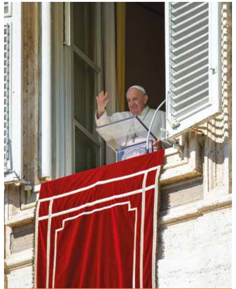
IL PAPA SALUTA I FEDELI IN PIAZZA SAN PIETRO

Nei giorni scorsi il Santo Padre ha ricevuto in udienza i partecipanti alla Conferenza Internazionale «Sradicare il lavoro minorile, costruire un futuro migliore», or-