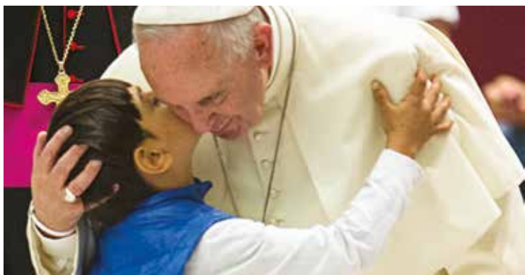
FRANCESCO ABBRACCIA UN BAMBINO

Un grido muto e disperato incatena la vita di troppi bambini e bambine, di oggi e di ieri, che tragicamente vivono, o continuamente rivivono, l'indicibile dramma dell'abuso, del maltrattamento, della violenza da parte di chi si dovrebbe o si sarebbe dovuto prendere cura di loro. Ogni forma di abuso (sessuale, di coscienza, di potere) costituisce un profondo trauma, che condanna il minore che lo subisce ad una prigione di sofferenza, che lo accompagnerà per tutta la vita, con forme ed esiti diversi, ma certamente dram-