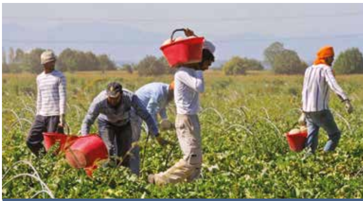
LO SFRUTTAMENTO LAVORATIVO DI ESSERI UMANI

La Congregazione Figlie della Carità di San Vincenzo de' Paoli, è impegnata dal 2003 nella lotta al fenomeno della tratta e del grave sfruttamento di esseri umani con il progetto «Elen Joy». Oggi la Congregazione amplia la propria attività con l'intervento nel contrasto al caporalato, al lavoro irregolare e allo sfrut-