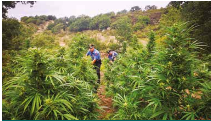
IL SEQUESTRO DI UNA PIANTAGIONE

N on c'è giorno nel quale la cronaca non registri un sequestro di piantagione di marijuana. Sembra quasi che la Sardegna sia diventata l'Afghanistan, e la coltivazione di piante può far crescere il mercato degli stupefacenti.